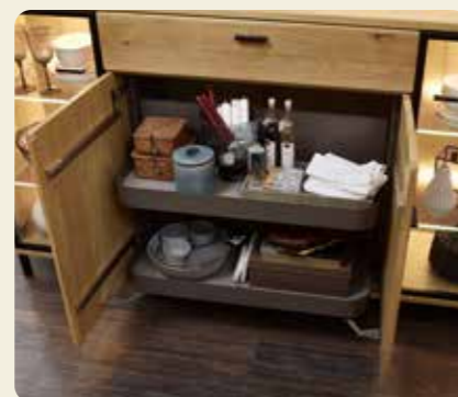
Stauraum wird dank des Komfort-Tablar-auszugs neu zugänglich..