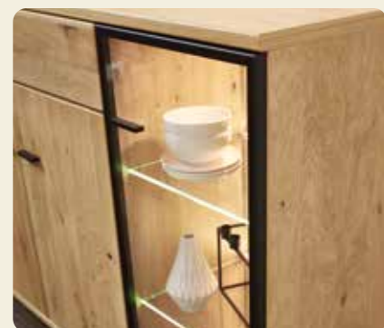
Der Vitrinenrahmen in schwarz bietet einen modernen Kontrast.