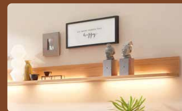
Das Wandbord lässt sich stimmungsvoll in Szene setzen.