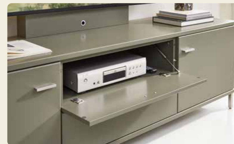
Hinter der Technikklappe haben Sie Stauraum für allerlei Equipment.