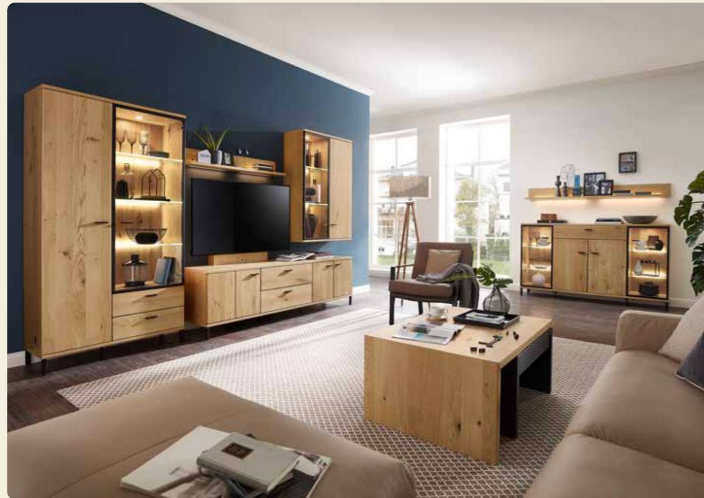
Wohnkombination 64397, B/H/T ca. 345/209,5/48,7 cm, Couchtisch 92377, Gesamtbreite: 142 cm, Grundtisch: B 72 x 72 cm, H: 40 cm, L-Tischplatte: B 100 x 72 cm; H 45,2 cm, Sideboard mit Füßen 64398, 2 Raster; B/H/T ca. 180/103,9/39,1 cm, Wandbord 90209, B/H/T ca. 180/17/21,4 cm Ausführung: Asteiche