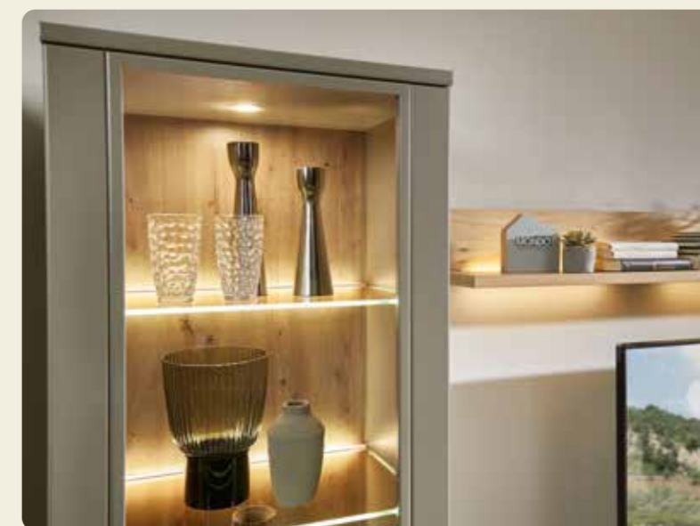
Vitrine und Wandbord verbreiten eine angenehme Lichtstimmung.