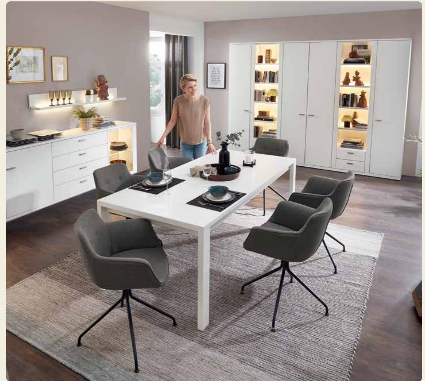
Sideboard 64254, B/H/T ca. 270/75,6/39,1 cm, Wandbord 90207, B/H/T ca. 150/17/21,4 cm, Esstisch 90346, B/H/T ca. 208/75/95 cm, Vitrine 64255, B/H/T ca. 300/218,3/39,1 cm, Ausführung: Lack Weiß

Als Zubehör für die Schubkasten-Organisation bieten wir ein universales System an, das Sie für sämtliche Modelle nutzen können. Die Einteilungen sind miteinander kombinierbar, sodass für jeden Zweck eine optimale Lösung gefunden wird. Für jede Korpus-tiefe, gleich ob Garderobe, Regal oder Wohnelement, können Sie eine passgenaue Einteilung wählen. Neben dem Vollauszug gehört eine griffige Antirutschmatte in dem neutralen Farbton Kaffee Crema zur Grundausstattung. Die Einteilung selbst ist komplett in Lack Magma gehalten und fügt sich so harmonisch in das Gesamtbild ein.