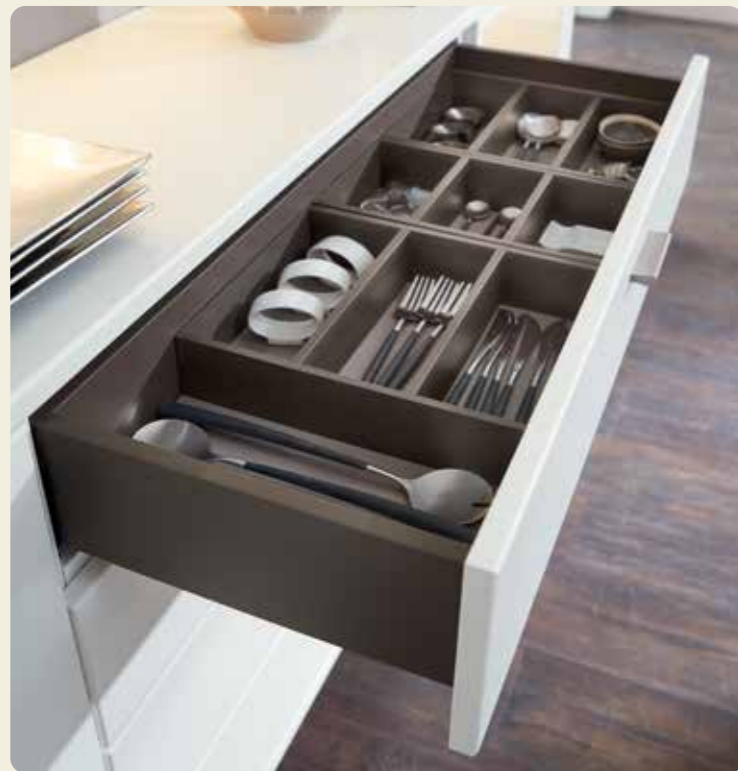
Schubkästen auf Wunsch mit Besteckeinsatz aus Holz.

Genießen Sie unterhaltsame Stunden im Kreise Ihrer Familie und Freunde beim Essen oder Feiern. Der erweiterbare Esstisch lädt auch zu größeren Runden ein. Das Speisezimmer bietet den passenden Rahmen mit viel Liebe zum Detail, zum Beispiel in der LED-Glaskanten- bzw. Bodenbeleuchtung oder dem modernen Hängesideboard.