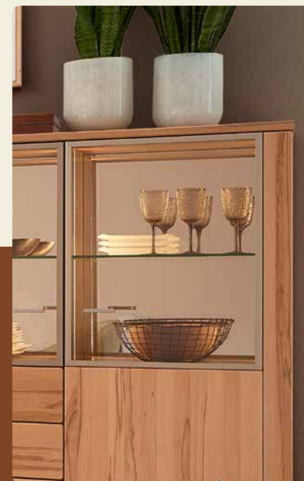
Der brünierte Alurahmen und das Parsolglas sind ein Highlight.